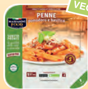
PRIMI PRONTI SURGELATI