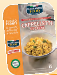
PASTA FRESCA SURGELATA