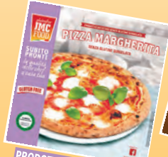
PRODOTTI DA FORNO